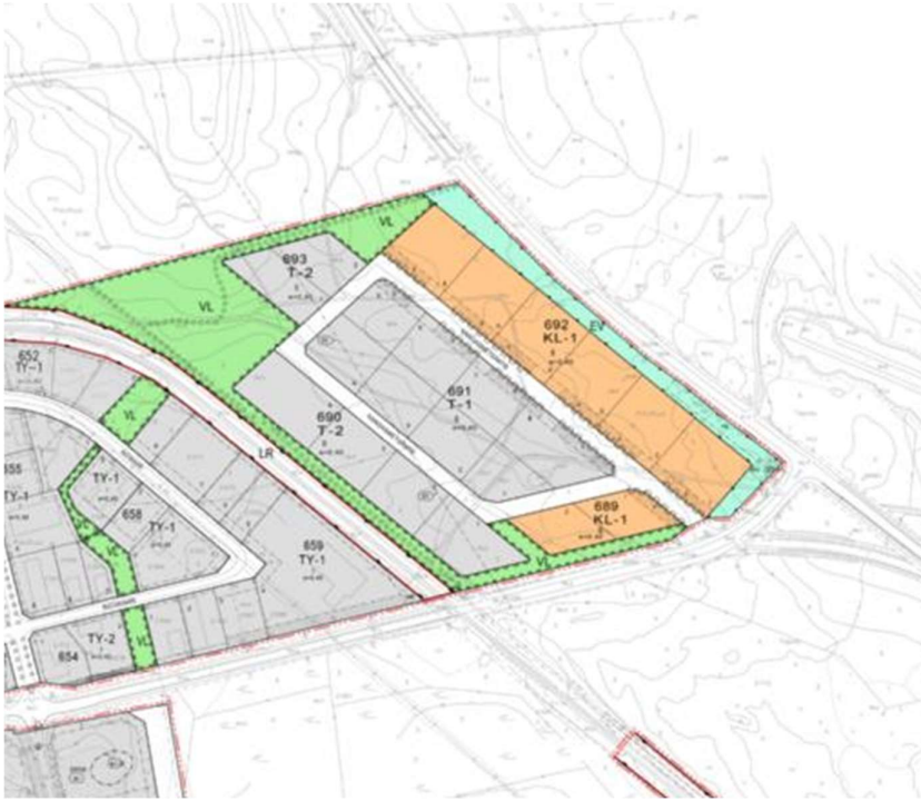
Neitsytmäki 2 teollisuusalue

Jatkoalueet reitin alkuosan (VE1) osalta ovat kaavoittamattomia lukuun ottamatta Satakunnankadun jatkolinjausta ja risteystä Seututie 204 kanssa.