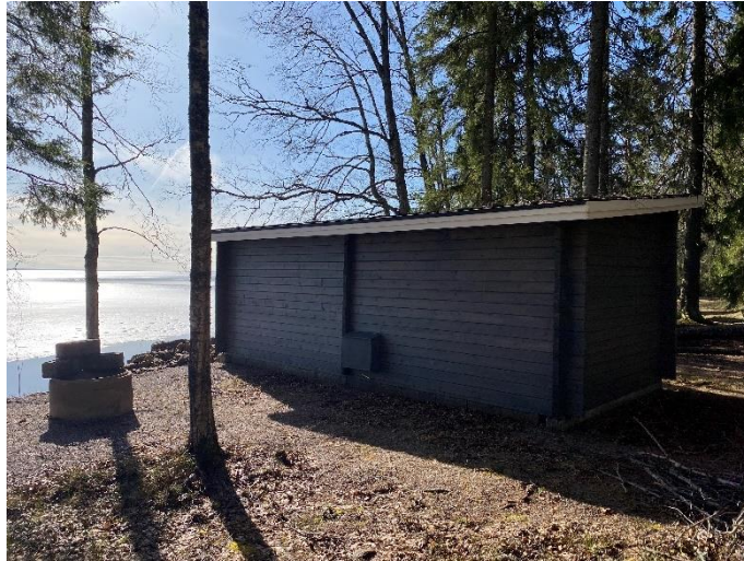
Venevaja suunnittelualueen itäosassa.