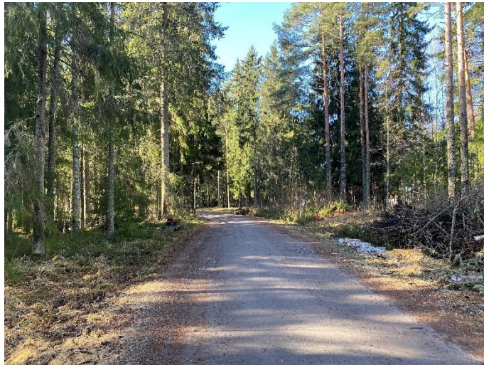
Tiitisentie suunnittelualueen itäosassa.