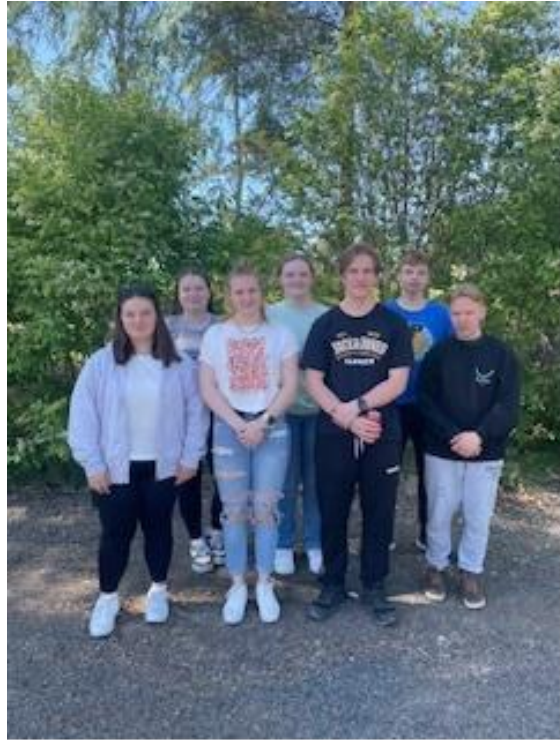
Kuvasta puuttuu Pihla Ahlgren