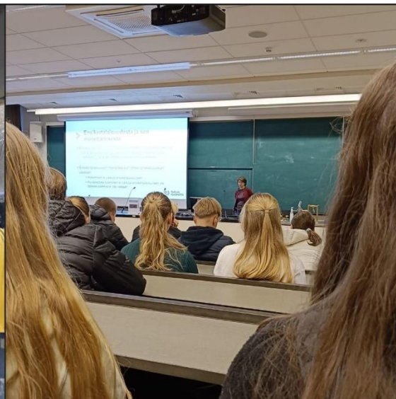
Abit osallistui- vat Turun yli- opistopäivään 10.11.