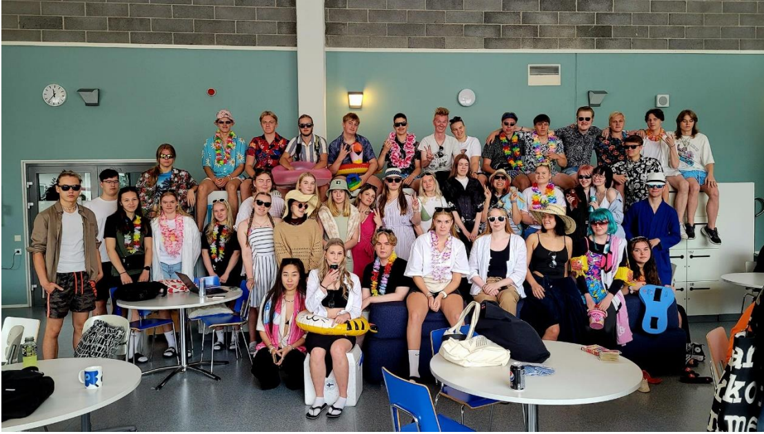
Abit TJ 100