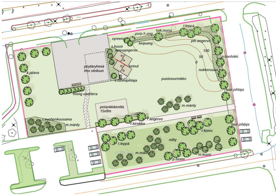
Kuva 2. Ote paloaukean yleissuunnitelmasta (2023).