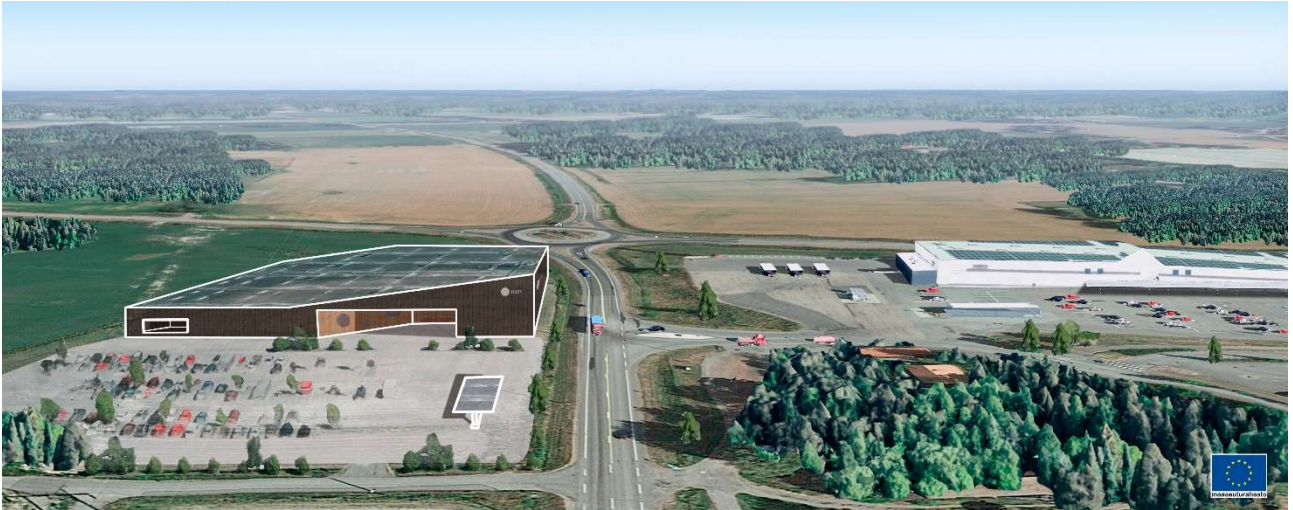
Kuva 3. Metsäkeskus/Prizztech LSPUU-hankkeen projektipäällikön arkkitehti Dennis Somelarin avaus Souppaan alueen suunnitteluun.