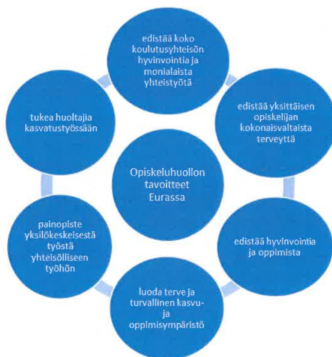
Kuvio 1. Opiskeluhoollon tavoitteet Eurassa

Opiskeluhoollon suunnittelussa, toteuttamisessa ja arvioinnissa keskeisiä asioita ovat opiskelijoiden, huoltajien, henkilöstön, opiskeluhooltopalvelujen työntekijöiden sekä yhteistyötahojen osallisuus ja yhtenäiset toimintatavat. Opiskeluhoollon järjestäminen perustuu opetuksen tai koulutuksen järjestäjän ja Satakunnan hyvinvointialueen yhteistyöhön. Opiskeluhoollon palvelut ovat maksuttomia.