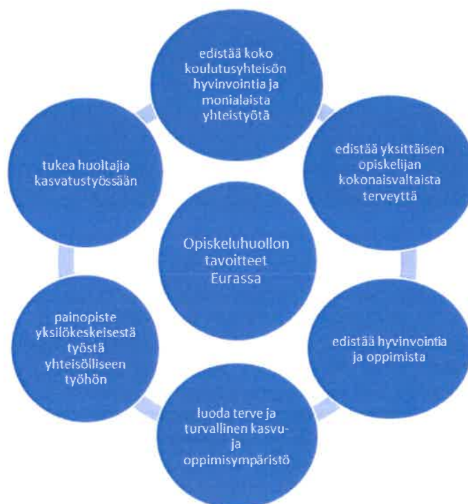
Kuvio 1. Opiskeluhuollon tavoitteet Eurassa

Opiskeluhuollon suunnittelussa, toteuttamisessa ja arvioinnissa keskeisiä asioita ovat opiskelijoiden, huoltajien, henkilöstön, opiskeluhuoltopalvelujen työntekijöiden sekä yhteistyötahojen osallisuus ja yhtenäiset toimintatavat. Opiskeluhuollon järjestäminen perustuu opetuksen tai koulutuksen järjestäjän ja Satakunnan hyvinvointialueen yhteistyöhön. Opiskeluhuollon palvelut ovat maksuttomia.