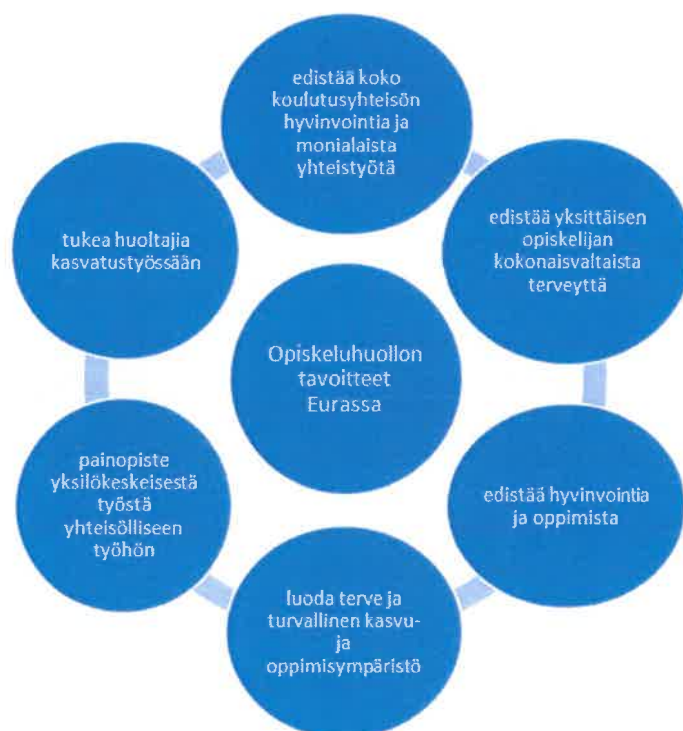
Kuvio 1. Opiskeluhoollon tavoitteet Eurassa

Opiskeluhoollon suunnittelussa, toteuttamisessa ja arvioinnissa keskeisiä asioita ovat opiskelijoiden, huoltajien, henkilöstön, opiskeluhooltopalvelujen työntekijöiden sekä yhteistyötahojen osallisuus ja yhtenäiset toimintatavat. Opiskeluhoollon järjestäminen perustuu opetuksen tai koulutuksen järjestäjän ja Satakunnan hyvinvointialueen yhteistyöhön. Opiskeluhoollon palvelut ovat maksuttomia.