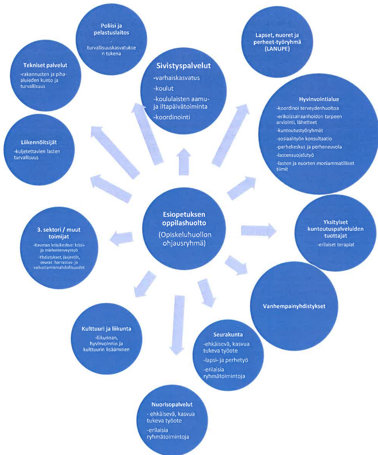
Kuvio 2. Opiskeluhoollon yhteistyötahoja Eurassa